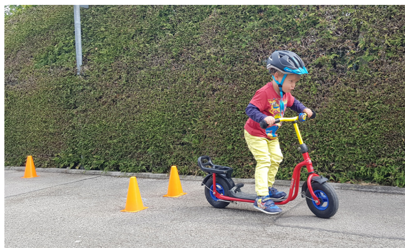
Das Projekt „Bewegt in die Zukunft“ richtet sich an Kindertagesstätten: Neben der Verkehrssicherheit stehen Bewegung und Rücksichtnahme im Vordergrund.

Der Begriff „Mobilität“ bezeichnet allgemein die Beweglichkeit, er umfasst sowohl die physische als auch die psychische sowie die soziale. Bei der Mobilitätsbildung geht es jedoch nur um die Vermittlung von Wissen über die räumliche Bewegung, insbesondere im Verkehr.