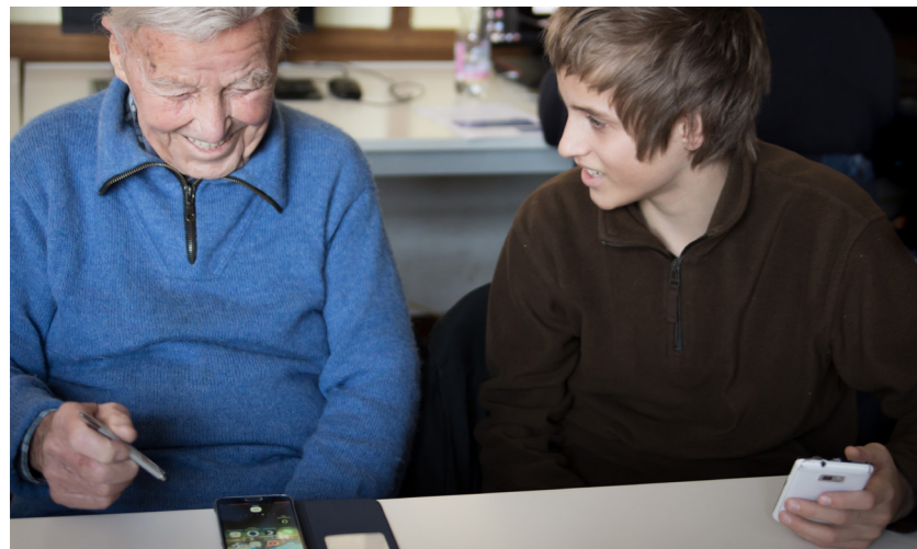
Beim Intergenerationenprojekt transfer geht es um die Vermittlung von Zugängen zu Mobilitätsformen.

„Startklar“ und „Radeln for future“ sind Teile des Integrativen Mobilitätszentrums, gefördert vom Münchner Referat für Klima und Umweltschutz. „Startklar“ richtet sich an Viertklässler:innen, bei denen der Schulwechsel auf die weiterführende Schule bevorsteht. Die Unter-